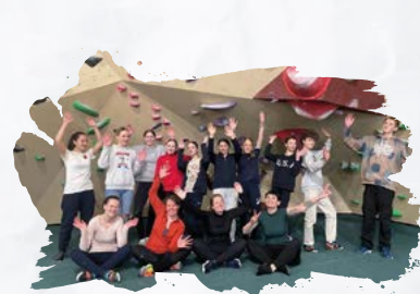
Erasmus-Sport-Projekt ZWOLLE, NIEDERLANDE

Die EU-Förderung deckt die Fahrt- und Unterbringungskosten und in der Regel sämtliche Unkosten, die vor Ort entstehen können. Die Unterbringung findet bei den meisten Maßnahmen in Gastfamilien statt.