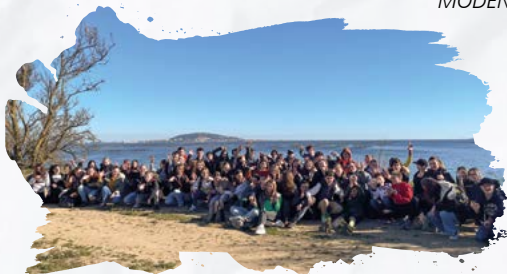
Erasmus-Projekt, SAINT-CLEMENT, FRANKREICH-2