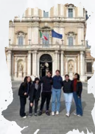
Erasmus-Schulaufenthalt, MODENA, ITALIEN